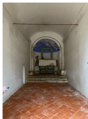
Restauration totale du plafond voûté, moulures et enduit de plâtre d'une chapelle Signes (83)