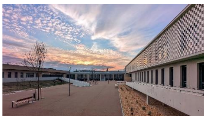
Construction du nouveau collège Voltaire Remoullins (30)