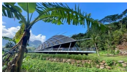
Te Fare Natura Eco-musée Moorea-Maiao (98)