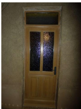
Porte d'entrée à l'identique de l'origine mais avec étanchéité renforcée Le Bois-D'Oingt (69)