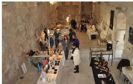
La carrière Sarragan, dernière carrière souterraine en activité en région PACA, ouvre ses portes.

Quant à la Carrière Sarragan, (qui ouvre ses portes au public spécialement pour l'occasion), le forum des entreprises