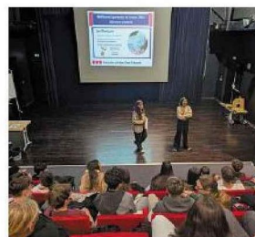
Une co-présentation par la Chambre de métiers et de l'artisanat et la conseillère d'orientation du CIO de Brignoles.

Les orientations possibles ont été développées par la conseillère d'orientation. Qu'ils soient dans le domaine de la bijouterie-joaillerie, de l'ébénisterie, de la charpenterie, de l'horlogerie et des autres métiers d'art, le point commun entre tous est le niveau d'excellence de leur savoir-faire. La transmission est un point essentiel pour leur préservation. L'objectif de cette intervention est aussi de susciter des vocations et de montrer qu'il existe de nombreuses filières d'excellence autres que